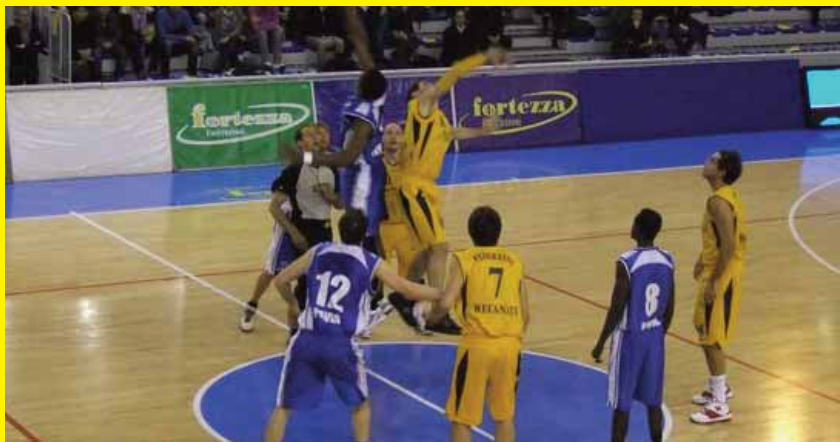
Foto dell'incontro della scorsa stagione